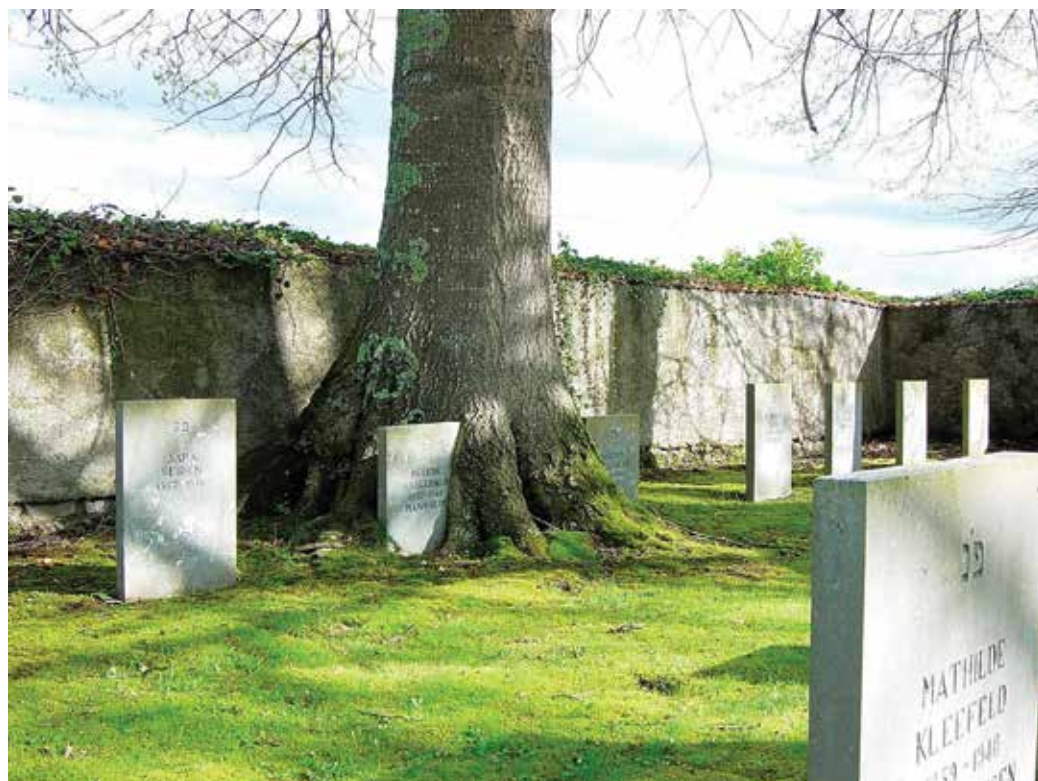
Un coin du cimetière du camp pendant la cérémonie

La cérémonie s'est poursuivie par les dépôts de gerbes, d'abord au monument national du Mémorial du camp, puis aux deux stèles érigées à la mémoire des internés, à l'intérieur du cimetière du camp.