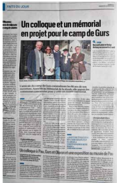
La République, 24 mars 2019