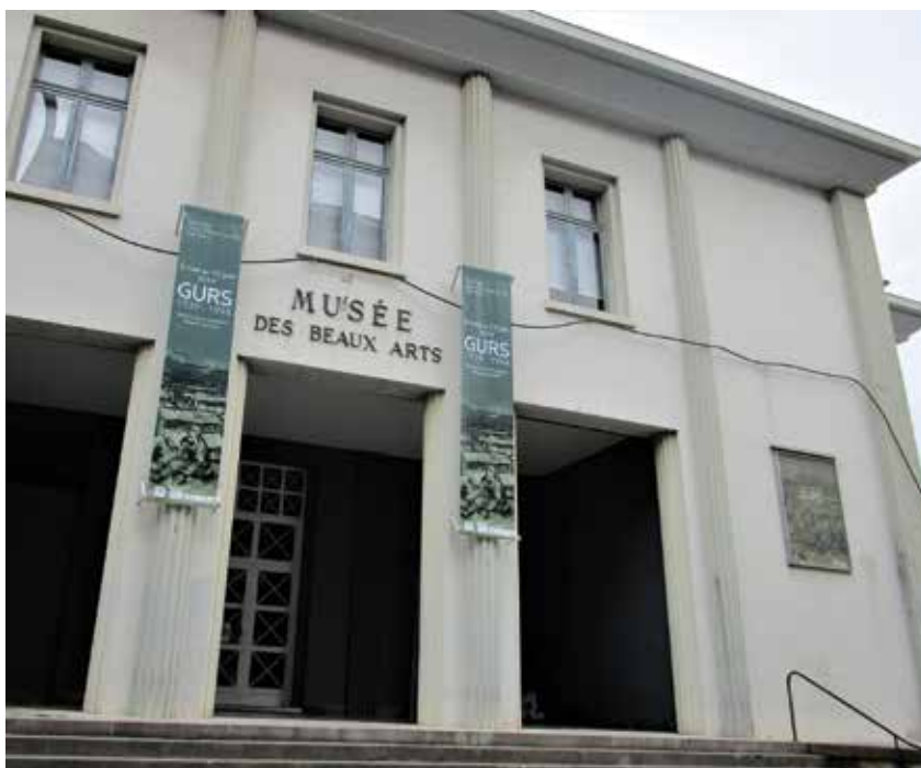
La façade du musée des Beaux-arts (avril-juin 2019)