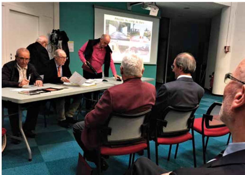
Vue prise au cours de l'Assemblée générale.