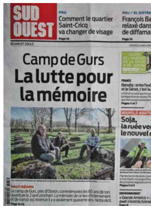
Sud-Ouest, 22 mars 2019